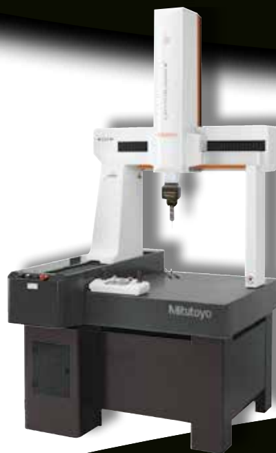
CRYSTA-Apex V 544

Meetbereik x: 500 mm y: 400 mm z: 400 mm